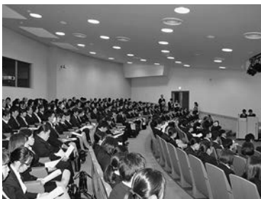
合同入社式の様子

職員らは、4月3日(火)～5日(木)の3日間にわたり各部門の説明や接遇研修などの全体オリエンテーションを受け、各部署に配属されました。