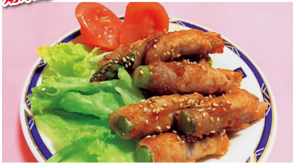
栄養管理課 管理栄養士 久田和香

春の訪れを告げる野菜として親しまれ、みずみずしさと甘い香りが魅力的なアスパラガス。年間を通して出回っていますが、最も旬な時期の5月は甘味があり、やわらかいの歯ごたえもある新鮮な国産品が登場します。ヨーロッパでは「春の宝石」と呼ばれ、栄養成分が豊富な野菜です。新陳代謝を促し、体力回復効果のあるアスパラギン酸には、たんぱく質の合成を高める働きもあり、美容効果も期待できます。β-カロテン、ビタミンB 1 、B 2 、食物繊維なども豊富です。また、穂先には高血圧や動脈硬化などの生活習慣病を予防するルチンが含まれています。美味しいだけでなく、健康や美容にも嬉しい効果があるアスパラガスを積極的に食事に取り入れてみてはいかがでしょうか。