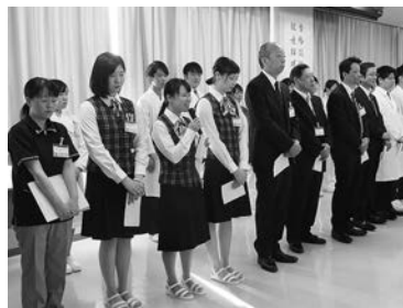
対面式で自己紹介をする 新入職員