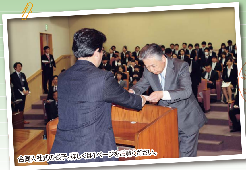
合同入社式の様子。詳しくは1ページをご覧ください。