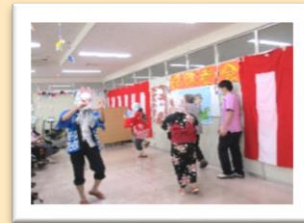
ひよっこ・おかめ・キツネは職員ですが、正体は分かりません。