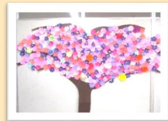
コスモスが何故か木に??

※現在、コロナウイルス感染症予防のためビューティーサポートは実施しておりません。