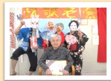
おめでとうございます！！これからもお元気に！！