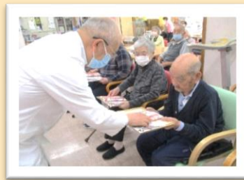
人見先生からお祝いです。