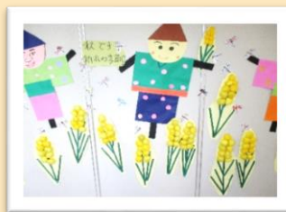
立派な稲と案山子ですね！