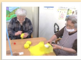
手先を使ってコツコツと…