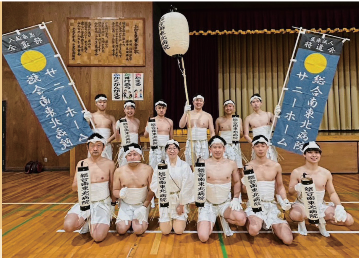
〈写真：竹駒神社どんと祭裸参りに参加しました〉 詳しくは5ページをご覧ください。